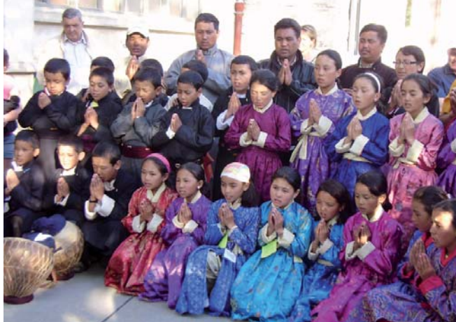
Des enfants du Ladakh à Die... ou lorsque deux cultures se rencontrent : une aventure passionnante et enrichissante pour les jeunes Diois.

GUIDE DES ASSOCIATIONS | La municipalité envisage d'éditer un guide des associations de Die. Toutes les associations désirant y figurer (insertion gratuite) sont invitées à communiquer : le nom de l'association, l'activité exercée (5 lignes maximum), l'adresse du siège, le nom du président et un numéro de téléphone.